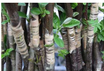
Junge Quittenveredlungen im Quartier austreibend

Kernobst Halbstamm Kronenveredlungen nach Vereinbarung Hochstamm Kronenveredlungen nach Vereinbarung