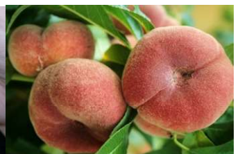
Veredelter Pfirsich Galaxia® Plattpfirsich