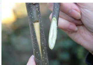
Veredlungsverfahren „Seitliches Anplatten“