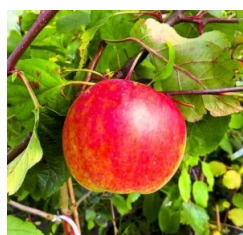
Apfelsorte Alma Ata