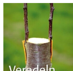
BLV-Buch „Veredeln“ von P.Klock