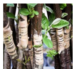
Junge Quittenveredlungen; im Quartier austreibend